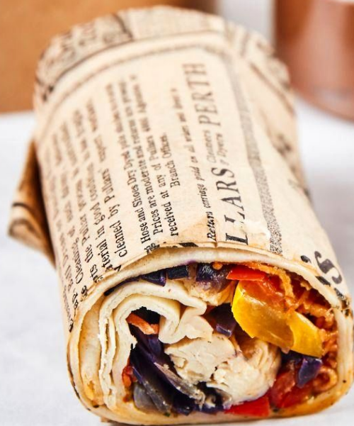
Wrap au poulet et légumes croquants