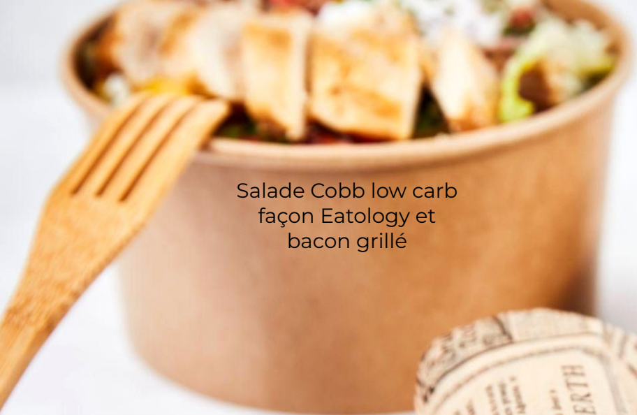
Salade Cobb low carb façon Eatology et bacon grillé