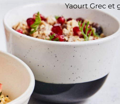
Yaourt Grec et granola