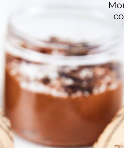
Mousse au chocolat et compotée de poires